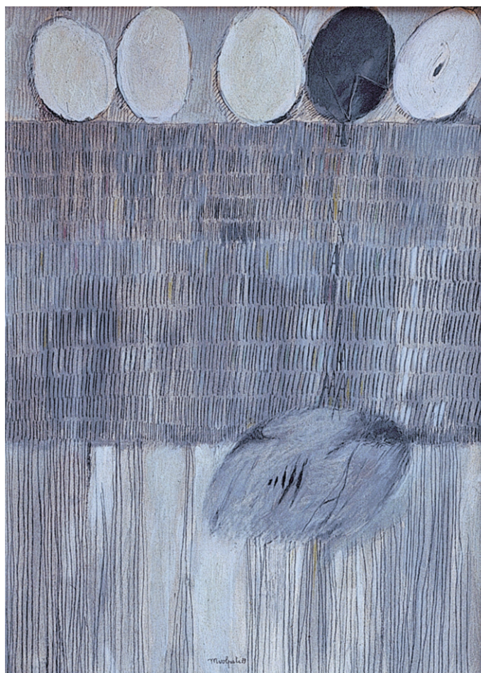
1979, Grigio, magia di un sogno , olio e pastelli su carta telata, cm 40 x 50