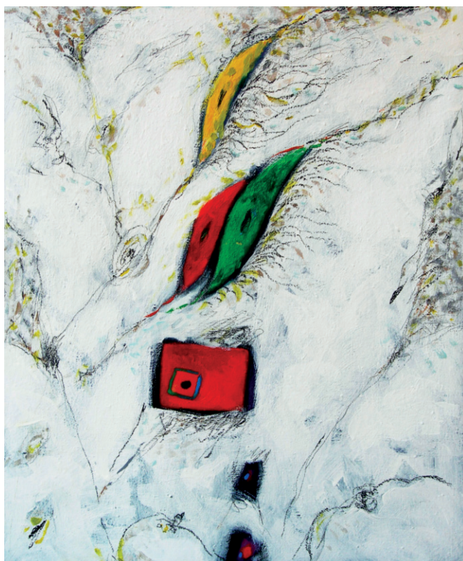
2018, Percorsi inclinati , olio e pastelli su tela, cm 40 x 50