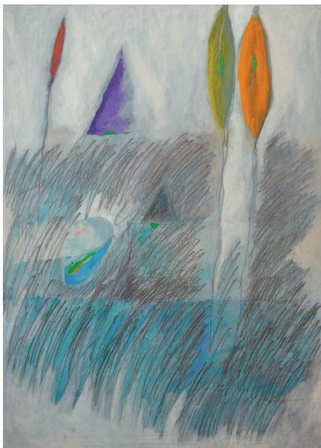
1979, Tre palloncini in volo , olio e pastelli su carta telata, cm 37 x 50