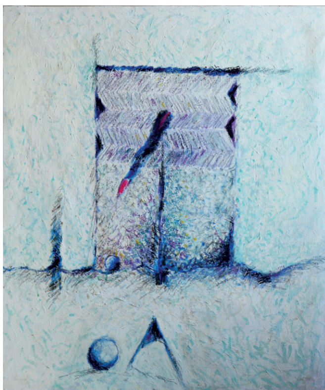
2016, Le parole dell'anima , olio e pastelli su tela, cm 50 x 60