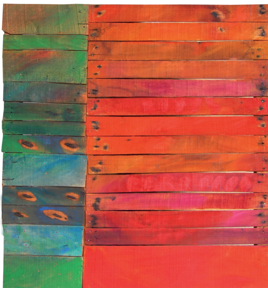
1986, Rosso e verde colori tipografici su legno, cm 49,5 x 44,5