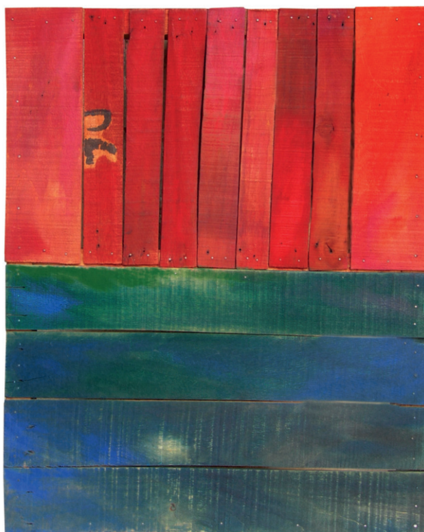
1986, Trasparenze , colori tipografici su legno, cm 36 x 44,5