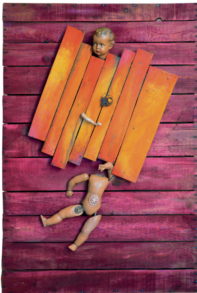
2020, Lo sguardo altrove , "assemblage", colori tipografici su strutture di legno, filo di ferro, bambole cm 70 x 103